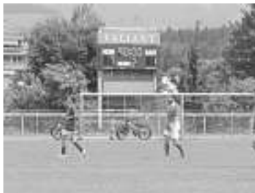
Abstieg, trotz 7:1-Sieg im letzten Spiel!