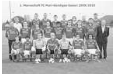
Gute Besserung allen Verletzten!