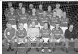
Wir gratulieren zum 2. Rang!