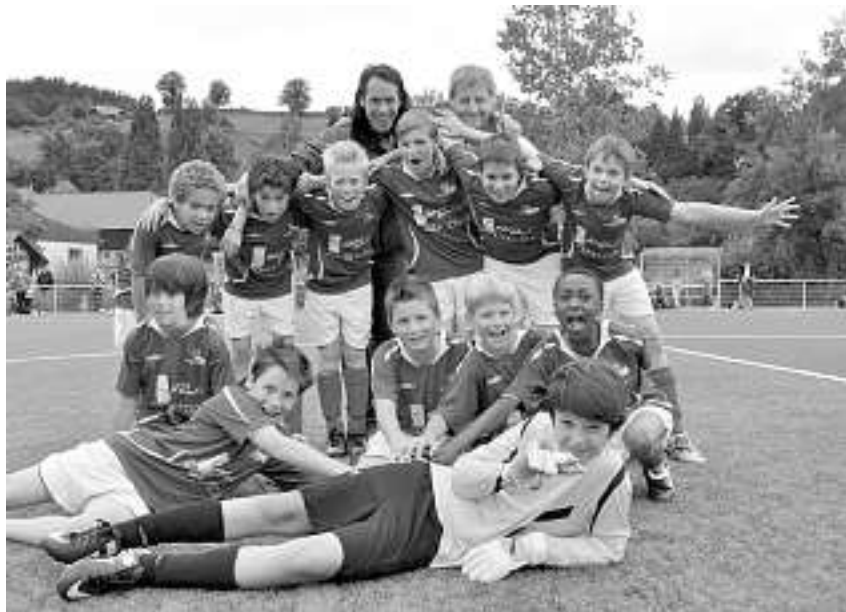
Meisterteam Dc, 2. Stärkeklasse Gruppe 4: