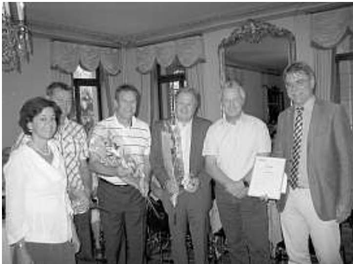
Der FC Muri-Gümligen gratuliert den Preisträgern ganz herzlich zum Muri-Preis 2011!