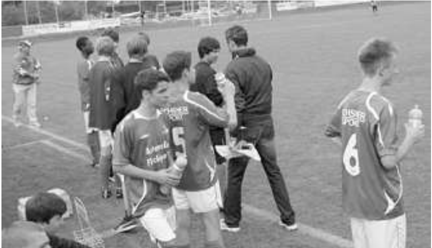
Das Spiel ging nun hin und her und auf der Bank wurde der Schlusspfiff herbeigeseht.