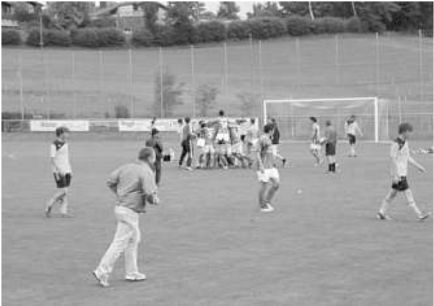
Endlich der Schlusspfiff, wir haben es geschafft... nun brachen alle Dämme und der Jubel konnte von nun an, glaublich bis spät in die Nacht hinein, keine Grenzen mehr. Insider wissen mehr!