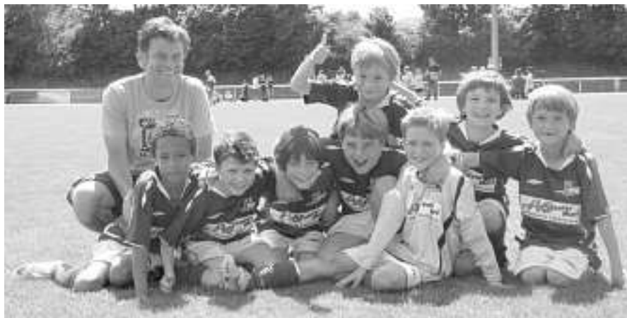
Das siegreiche Fb am Heimturnier

Wir verabschieden uns von den Kickern mit Jahrgang 2002 (Übertritt ins E) und wünschen ihnen eine tolle Fussballkarriere!