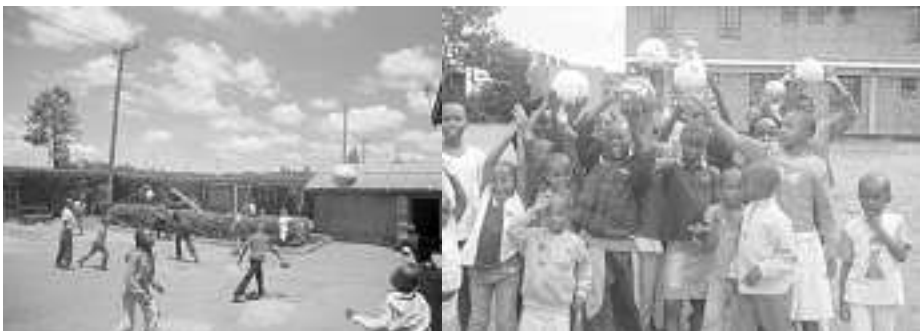
Fussbälle des FC Muri-Gümligen erfreuen Waisenkinder in Nairobi!

Wir danken herzlich für die sympathische Aktion!