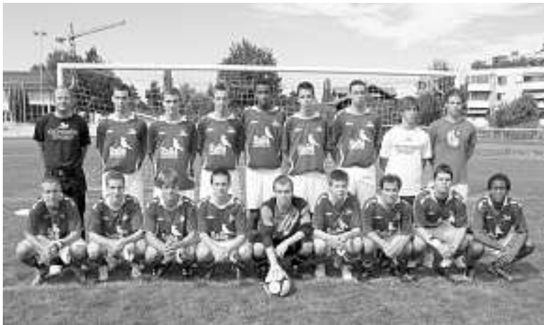
Dress-Sponsor: Radio RaBe