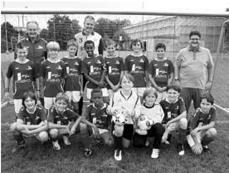
Dress-Sponsor: Stoller Baukeramik