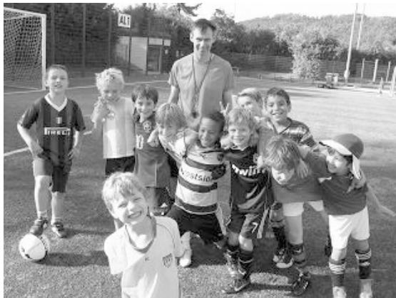
Motivierte Kicker beim Trainingsstart