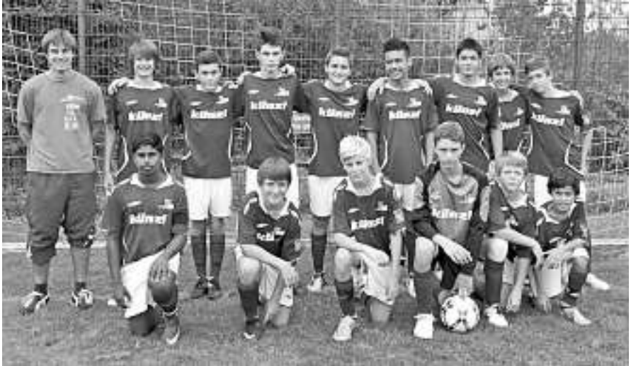
Dress-Sponsor: Adolf Künzi AG