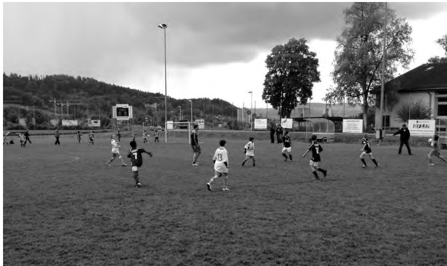
Das Ed in Action!