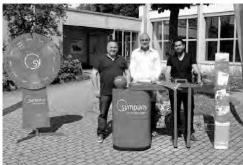
fcmg und Sympany Crew anlässlich des Sponsorenlaufs...

Dies nur eine kleine Auswahl der äusserst interessanten Konditionen!